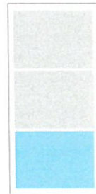
Klein 2sp/60 mm

*Kombination: Ausgabe Filder + Ausgabe Neckar je 25% Rabatt