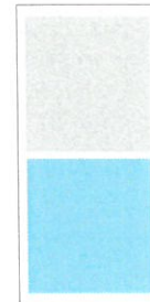
Mittel 2sp/94 mm